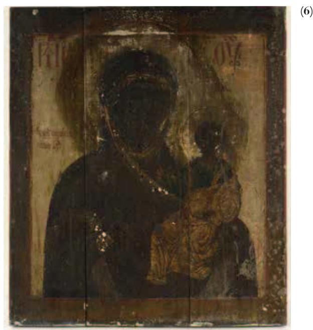
(5) Üks hävinud ikoonidest, Mark Solntsevi „Kristuse templisse toomine“. Foto Eesti Vabaõhumuuseumi konserveerimis- ja digiteerimiskeskus Kanut (6) Ikoonil „Smolenski Jumalaema“ kujutatud nägude kahjustused on nii suured, et maalingut ei ole võimalik restaureerida. Foto Eesti Vabaõhumuuseumi konserveerimis- ja digiteerimiskeskus Kanut

Muuseumi, Tartu Kunstimuuseumi, samuti Eesti Kunstiakadeemia ja Tartu Kõrgema Kunstikooli poole. Kõik institutsioonid olid nõus osalema ja panustasid üle ootuste suurte ressurssidega, nõnda et töötoas osales üle 40 inimese.