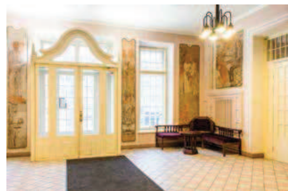
(1) Vaade juugendvillale Pärnu maanteelt. (2) Fuajee ja tambur ning Eeva-Aet Jänese seinamaalingud