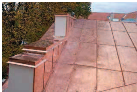
(1) Tartu Uspenski õigeuskikiriku vaade uue vaskplekist katusega. (2) Uspenski kiriku katuse plekitööde näide.