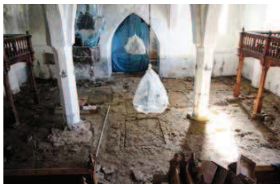
(1) Haljala kiriku plaan. Autor Villu Kadakas (2) Vaade võidukaare suunas pikihoone idaosale kaevamiste ajal. Vasakul piilari ees kõrvalaltari vundament, kesklöövis hauakambriid.