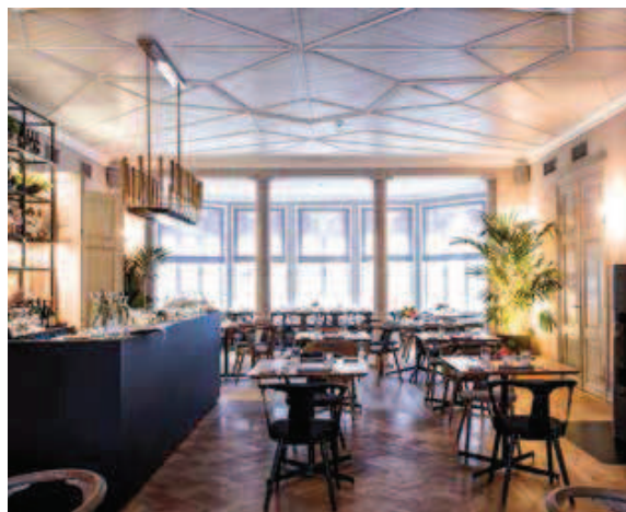
(1) Villa Mon Repos Kadrioru pargi poolt. (2) Esimese korruse saal.